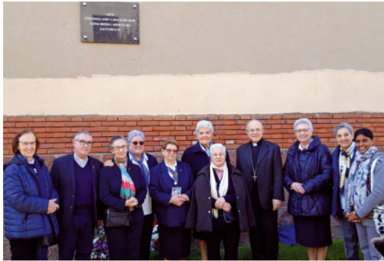
Religioses agustines missioneres amb el bisbe Agustí Cortés i Mn. Xavier Ribas

Diumenge 23 de febrer va ser un dia assenyalat a Gavà, per la benedicció d'un espai verd, adjacent a la Parròquia de Sant Pere, dedicat a Esther Paniagua i Caridad Álvarez, religioses agustines missioneres, que van morir a Argel l'any 1994, en el context de persecució religiosa que vivia aleshores el país magrebí. El 8 de desembre de 2018 van ser beatificades a Oran, juntament amb altres religiosos màrtirs, entre ells el bisbe d'Oran, Pierre Claverie, i els 7 monjos francesos de Tibhirine.